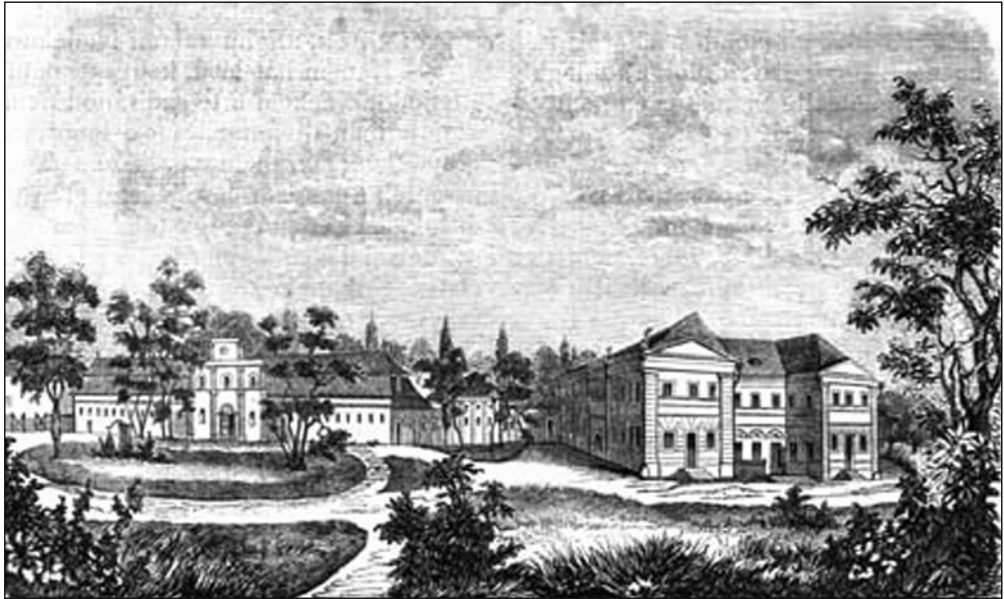
A Károlyi József által újjáépíttetett kastély 14

hozzá, a kastély főépületét és a konyhát folyosók kötötték össze. Ezzel a megoldással száműzték a kastélyból a konyhaszagot. Ennek folytatásában volt a lovarda és az istálló, amelyeket még Károlyi Antal építtetett.